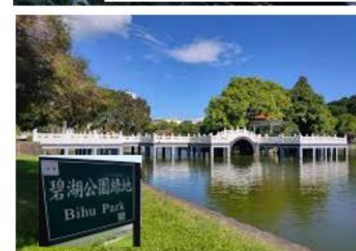
碧湖公園與醫 院距離步行7 分鐘