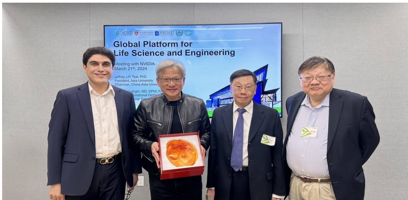
圖：亞大校長蔡進發(右 2)、美國哈佛大學醫學院 Alireza Haghighi 教授(右 4)、黃光彩講座教授(右 1)，前往 NVIDIA 總部，與 NVIDIA 創辦人黃仁勳(右 3)，針對智慧醫療領域深入交流。