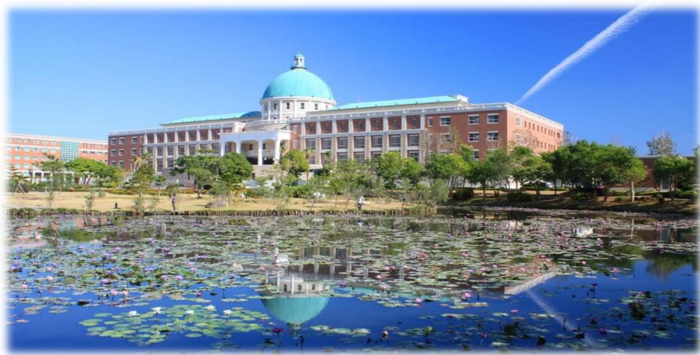
圖：就讀亞大，就是就讀一所「綜合大學」+「醫學大學」+「國際大學」