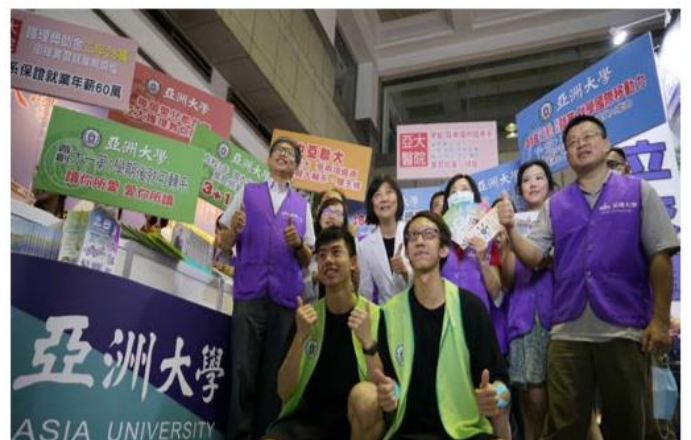
(招生處行政團隊參加大學博覽會)

校址：台中市霧峰區柳豐路 500 號 招生諮詢專線：04-23323456#3132~3135 網址： https://rd.asia.edu.tw