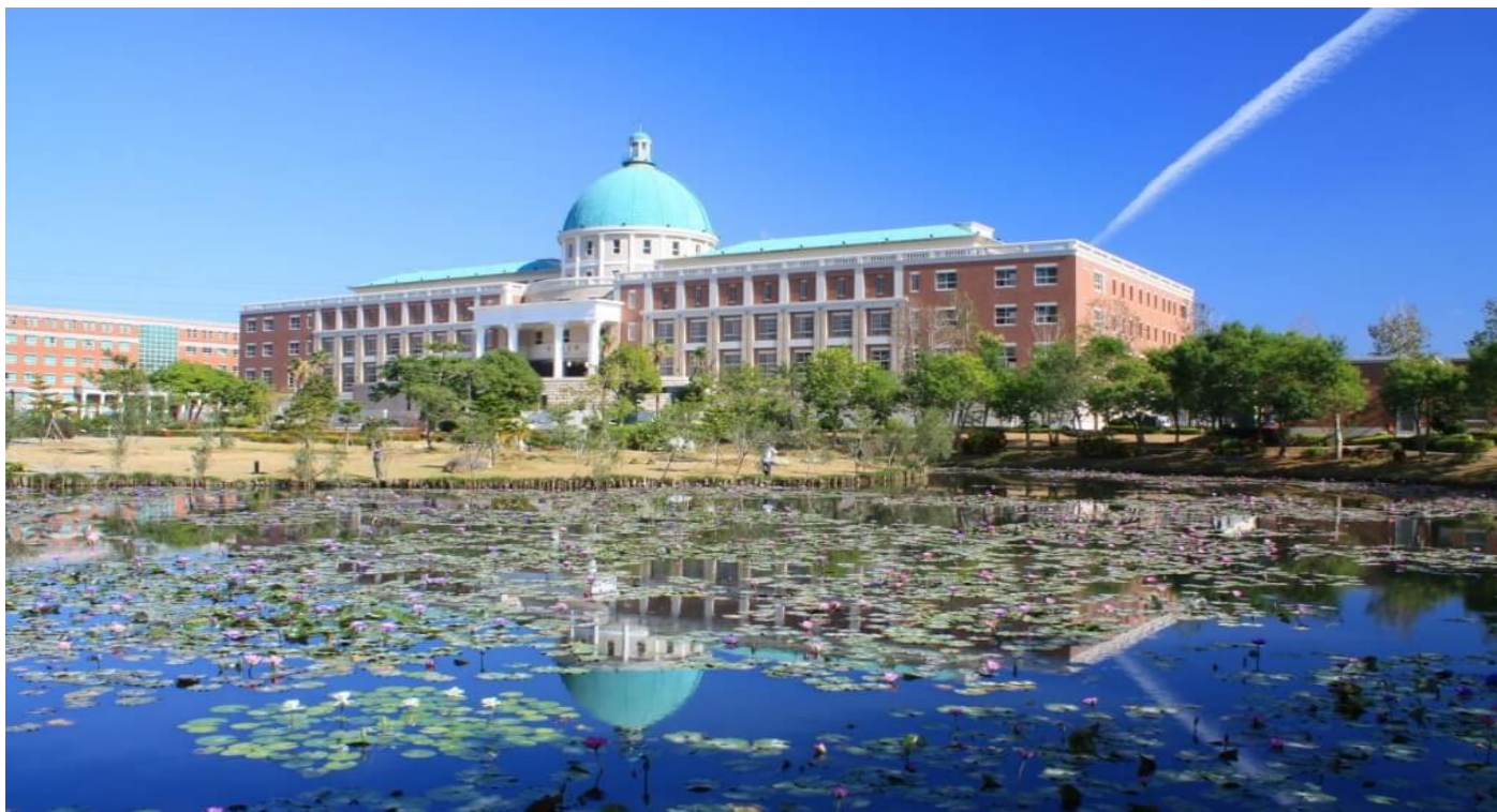
圖：就讀亞大，宛如就讀一所「綜合大學」+「醫學大學」+「國際大學」