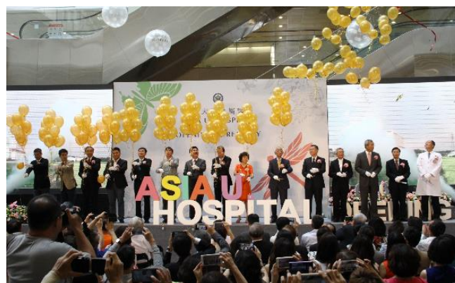
亞洲大學附屬醫院