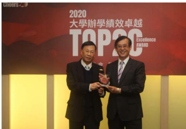
(大學辦學績效 TOP20，亞大全台第 9 名！)