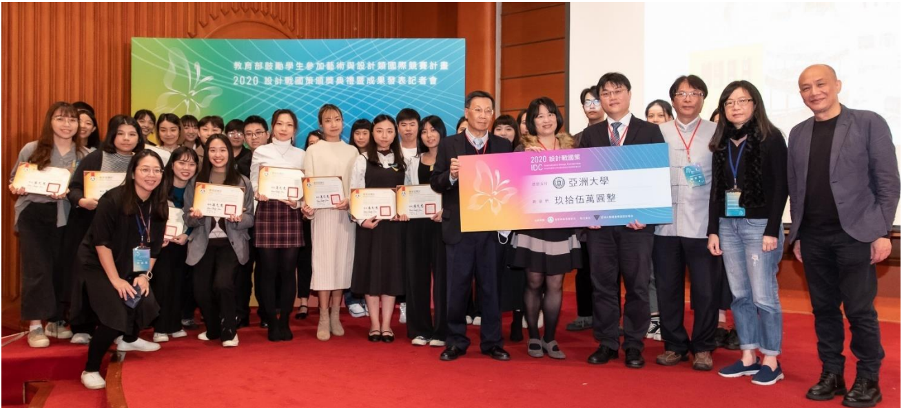
亞洲大學獲國際設計競賽 7 年高教第一！