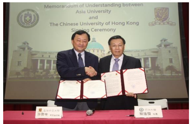
圖：亞大校長蔡進發、香港中文大學常務副校長...