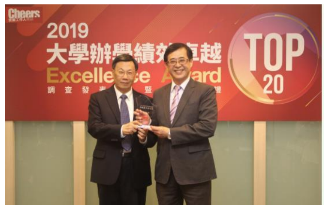
(圖：大學辦學績效 TOP20，亞大全台第 5 名！)