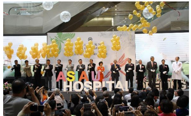
圖：2016 亞洲大學附屬醫院開幕