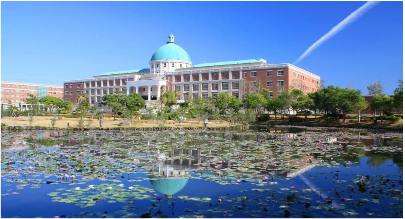
圖：就讀亞大，宛如就讀一所「綜合大學」+「醫學大學」+「國際大學」