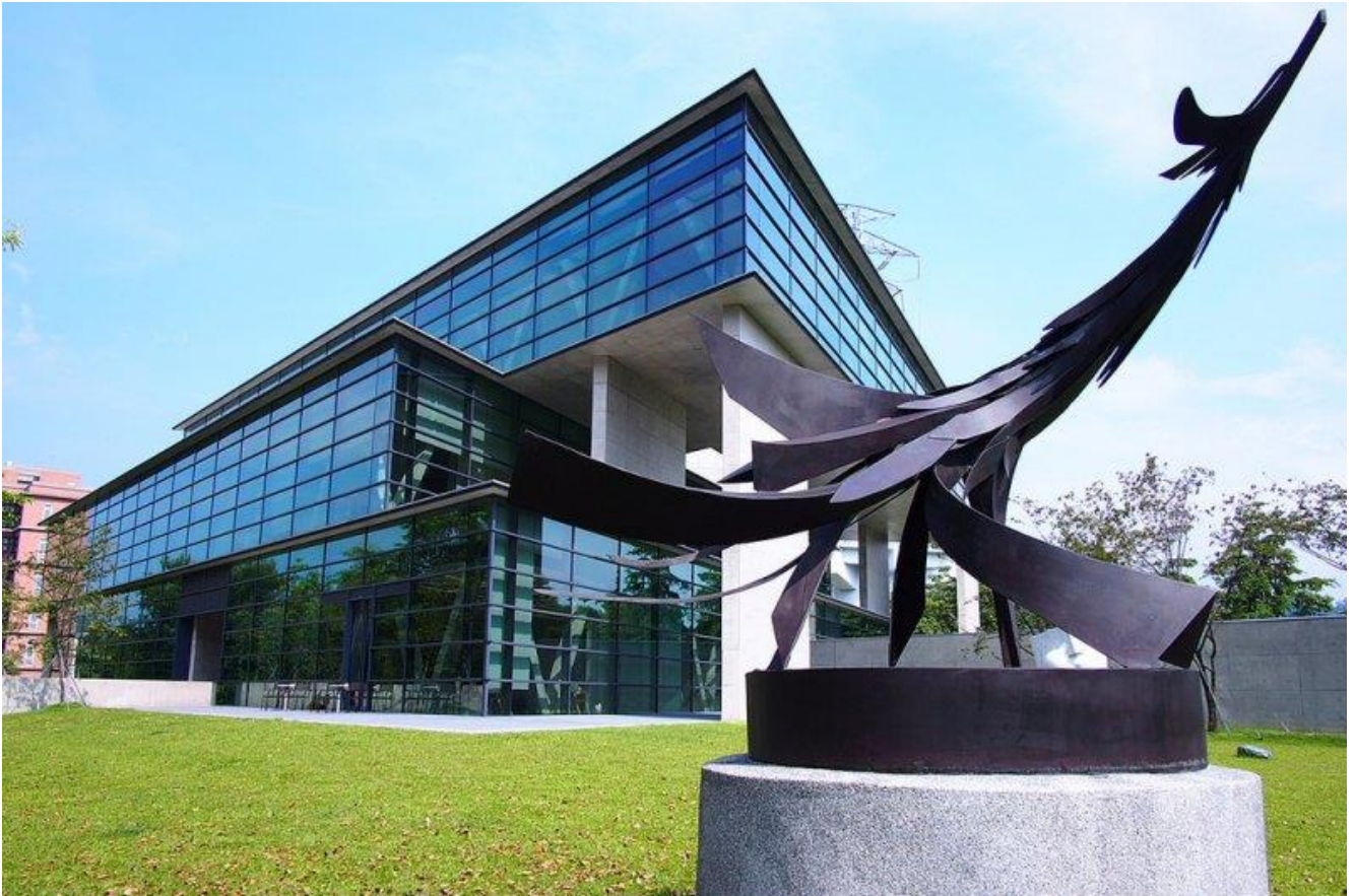
圖：中國時報舉辦「大專校院校園風景網路人氣票選」亞大安藤美術館入選全台校園十大美景！