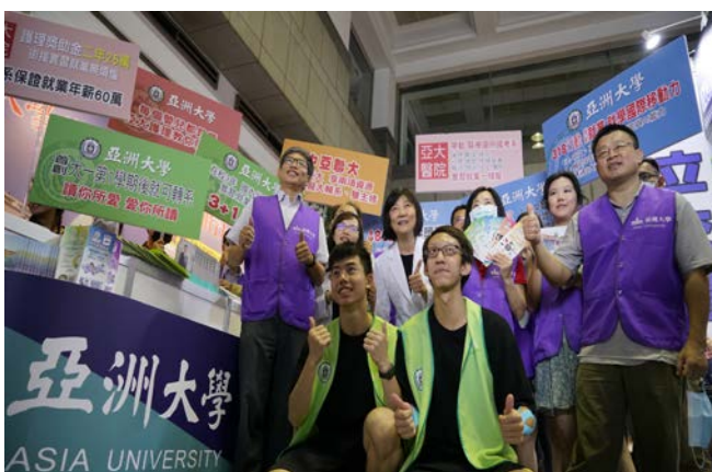
(圖：招生處行政團隊參加大學博覽會)