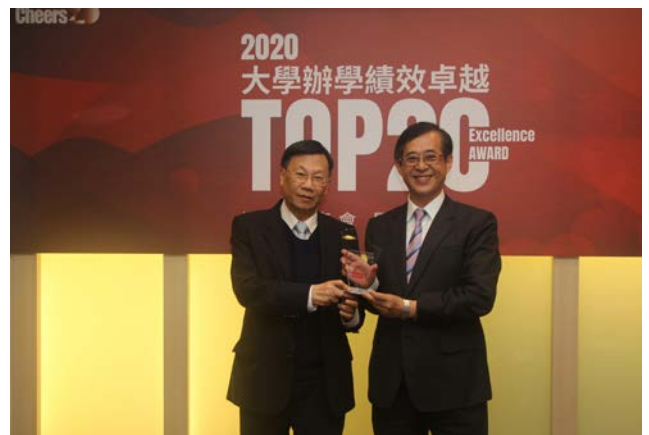
(圖：大學辦學績效 TOP20，全台第 9 名！)

校址：台中市霧峰區柳豐路 500 號 招生諮詢專線：04-23323456#3132~3135 網址： http://rd.asia.edu.tw