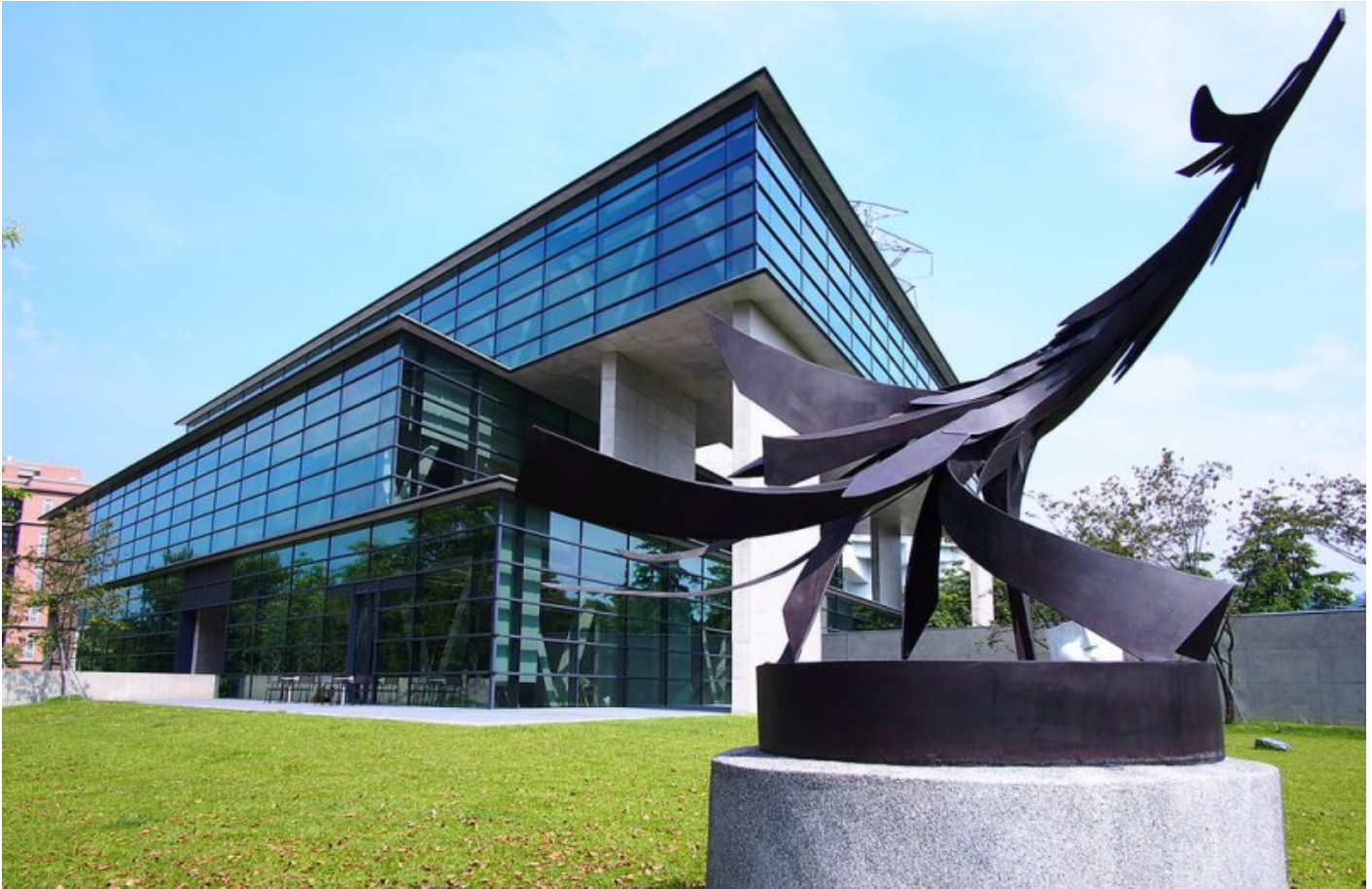
圖：中國時報「大專校院校園風景網路人氣票選」亞大安藤美術館入選全台校園十大美景！