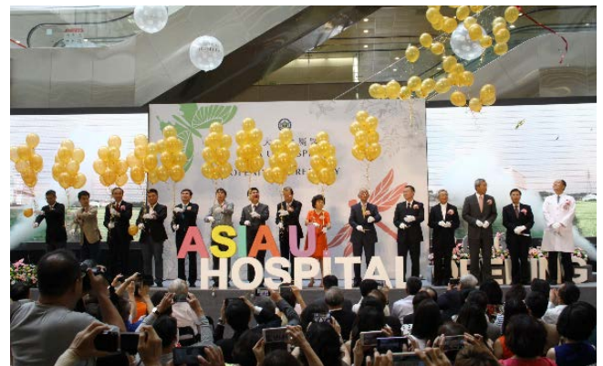
圖：2016 亞洲大學附屬醫院開幕